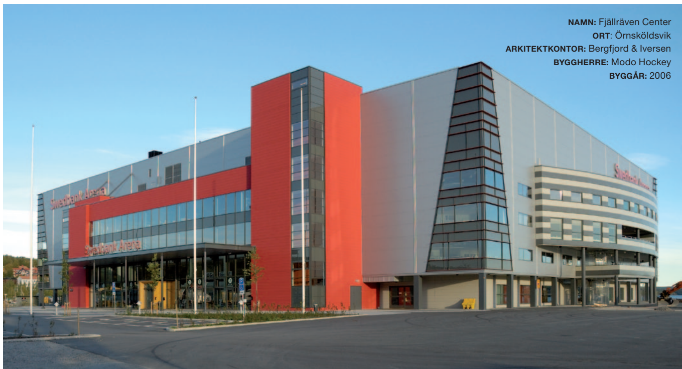
NAMN: Fjällräven Center ORT: Örnsköldsvik ARKITEKTKONTOR: Bergfjord & Iversen BYGGHERRE: Modo Hockey BYGGÅR: 2006

Strängbetong är Sveriges ledande företag inom prefabricerade byggnadssystem. Företaget har cirka 1200 anställda, verksamhet på 13 platser i landet och en omsättning på närmare 2,3 miljarder kronor. Strängbetong ingår i den internationella koncernen Consolis.