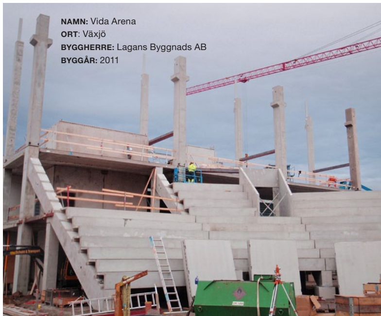
NAMN: Vida Arena ORT: Växjö BYGGHERRE: Lagans Byggnads AB BYGGÅR: 2011