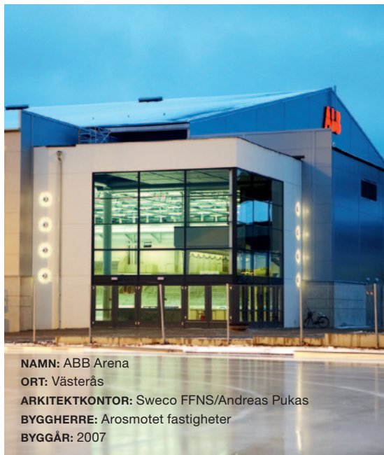
NAMN: ABB Arena ORT: Västerås ARKITEKTKONTOR: Sweco FFNS/Andreas Pukas BYGGHERRE: Arosmotet fastigheter BYGGÅR: 2007